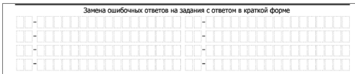
Рис. 3. Область замены ошибочных ответов на задания с кратким ответом

Запрещается записывать ответ в виде математического выражения или формулы. В ответе не указываются названия единиц измерения (градусы, проценты, метры, тонны и т.д.) – так как они не будут учитываться при оценивании. Недопустимы заголовки или комментарии к ответу.